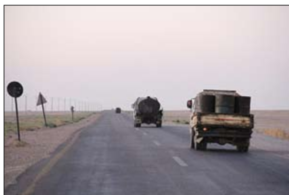
الجيش الحر ينقل امدادات الى مدينة دير الزور

قال ناشطون إن الجيش السوري الحر بدأ الأحد هجوما لاستعادة بلدة إستراتيجية بدرعا في وقت تستمر فيه المعارك على جبهات أخرى بينها حمص التي حققت فيها القوات النظامية تقدما كبيرا يحيي الخالدية المحاصر منذ شهر. وقالت لجان التنسيق المحلية إن الجيش الحر بدأ عملية واسعة في الريف الشرقي لدرعا في اطار ما سمي معركة بدر- حوران لاستعادة السيطرة على بلدة خربة غزالة التي تقع على الطريق الدولي بين دمشق ودرعا المتاخمة للحدود مع الأردن. وأضافت أن هذه الحركة تعد من أهم المعارك في سوريا عامة وفي درعا خاصة منذ بدء الثورة منتصف مارس آذار 2011. وفي اطار العملية التي بدأها الجيش الحر في الساعات الماضية قالت لجان التنسيق إن مقاتليه فجرها فوجوا عسكريا عندما كانت تقادر خربة غزالة. وتداول معارك في مناطق أخرى في درعا بينها بلدة الحازرة التي قتل فيها الجيش الحر قناصين من القوات النظامية عند حاجز المفزة وفقا للجان التنسيق. وقالت شبكة شام إن القوات النظامية قصفت بلدتين أخريين في محافظة درعا هما صيدا والنعيمة. وكانت بلدة نوى قد شهدت بدورها اشتباكات عنيفة في الأيام القليلة الماضية، كما سيطر الجيش الحر قبل يومين على مخفر حدودي بالمحافظة نفسها. وتأتي العملية العسكرية في الريف الشرقي لدرعا في حين يحتدم القتال على جبهة دمشق خاصة في حيي القابون وجوبر ومخيم اليرموك.