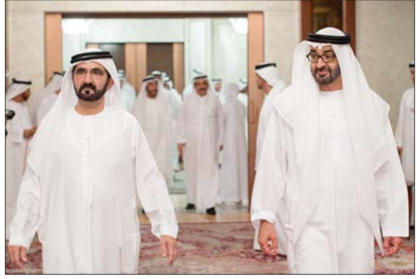
محمد بن راشد ومحمد بن زايد خلال حضورهما مأدبة إفطار أقامها نهيان بن مبارك

استمرار التوتر أمام التأسيس وفي جميع المحافظات التونسية المعارضة تسعى إلى تشكيل حكومة إنقاذ • الفجر - تونس - خاص مع تواتر الأنباء عن مبادرة سياسية جديدة من قبل الأطراف الحاكمة تتجه نحو توسيع قاعدة الائتلاف الحاكم ليشمل جزءا من أحزاب المعارضة ووضع خارطة طريق واضحة المعالم وملزمة للمرحلة القادمة من الانتهاء من الدستور وصولا إلى الانتخابات، يبدو أن الشرخ قد تعمق بشكل يعسر فيه التراجع والتوافق، وأن الانقسام في الشارع التونسي وفي المشهد السياسي، مجسدا في ساحة المجلس التأسيسي بين مناصري الشرعية ومعارضيه، بات أمرا واقعا وحقيقة يصعب تجاوزها في كل مبادرة ساعية إلى ترميم الأوضاع المتفائلة خاصة مع إصرار المعارضة على حل المجلس التأسيسي وتشكيل حكومة إنقاذ وطني مصغرة ومن مستقلين تتولى تسيير شؤون البلاد. فقد شرعت جبهة الإنقاذ الوطني المكونة من أحزاب الجبهة الشعبية والاتحاد من أجل تونس وعدد من المنظمات والجمعيات أمس الأحد بمقر الجبهة الشعبية في مشاورات حول تكوين حكومة إنقاذ وطني واختيار رئيس للحكومة. (التفاصيل ص 13)