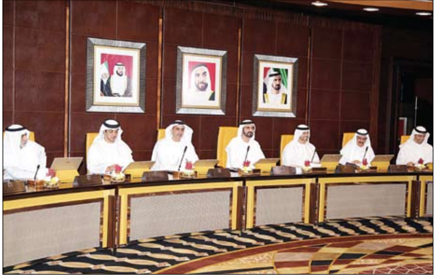
محمد بن راشد خلال ترؤسه اجتماع مجلس الوزراء