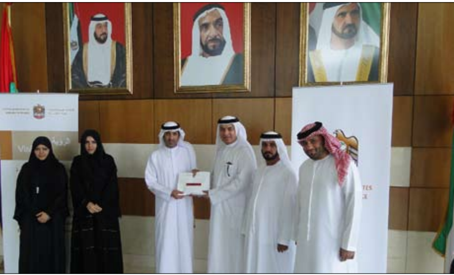
فيلماً خاصاً عن حياة وإنجازات زايد بن سلطان آل نهيان طيب الله تراه. وقامت بتوزيع الهدايا المغفور له بإذن الله تعالى الشيخ

محروم حول العالم، ونظمت الوزارة بالتعاون مع هيئة الهلال الأحمر الإماراتي حملة إفطار صائم، حيث تم توفير 1000 وجبة إفطار للمتحتاجين. أيام الشهر الفضيل الملتقى الرمضاني السنوي لموظفيها، حيث دعمت الوزارة موظفيها وقيادتها العليا لحضور مائدة إفطار، بحضور عدد من الأطفال الأيتام بدار زايد للرعاية الأسرية وأعضاء جمعية أصدقاء البيئة،