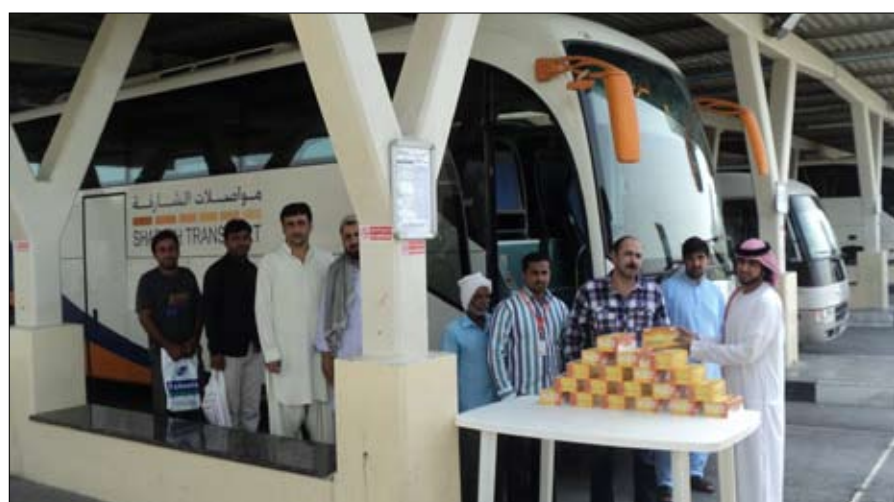
بين من يتوافدون على المحطة وللتراحم خلال الشهر الكريم وبين العاملين فيها.

التعاون وترسيخ مفهوم المسؤولية الاجتماعية في دعم الأعمال الخيرية، من خلال الشراكة والمعايشة، مشيراً إلى أن الوجبة توزع في صندوق مخصص يمكن حمله بسهولة، ويتم توزيعه على سائقي حافلات النقل بين المدن والمواصلات العامة ومستخدمي المحطة من ركاب الحافلات ومركبات الأجرة، إلى جانب العمال وحراس الأمن التابعين للمحطة، وذلك قبل الأذان بنصف ساعة. وأعاد مدير محطة الجبيل بجهود القائمين على هذا العمل الخيري من موظفي المحطة والجمعية