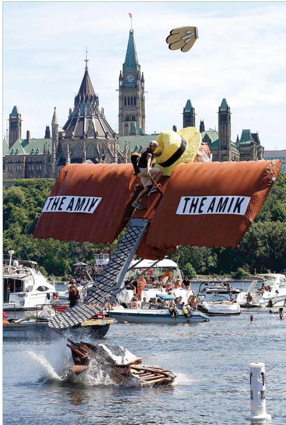
مشارك يدير آلة الطيران المصنوعة يدوياً خلال (يوم الطيران) في جاتينو بكندا.

أشعل لعب العيال، اشتباكا بالضرب والسب بين جارتين احدهما اردنية والاخرى سورية، وفقاً لقضية سجلها بحقهما الأمنيون في مخفر السالمية، ولا تزالان تخضعان للتحقيق. وقالت صحف كويتية ان «طفلين كانا يلعبان معا في باحة العمارة التي تقطنها أسرة كل منهما في منطقة السالمية، واقتبل كلاهما على الآخر من جراء الاختلاف على طريقة اللعب، وتبادلا الضربات، قبل ان تنتصر كل ام لابنتها، ما ادى الى اندلاع شجار بينهما وارتفعت وتيرته مع احتدام اللكمات والسياب المتبادلة، والتي تجاوز بعضها حدود الحياء، امام انظار بقية سكان العمارة الذين عجزوا عن فض الصراع، فسارعوا بإبلاغ غرفة العمليات..»