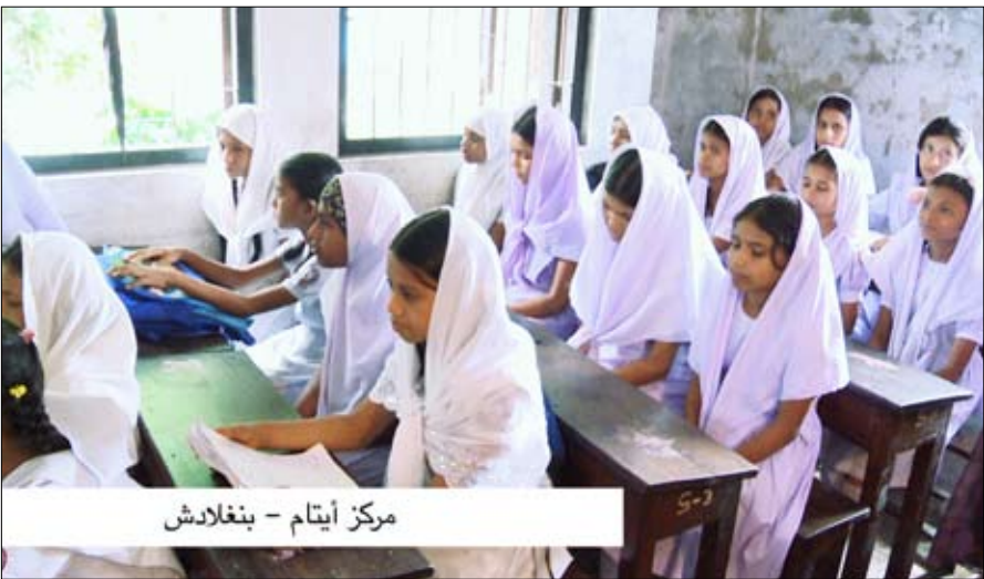
مركز آيتام - بنغلادش

وأضاف صاحب سمو حاكم عجمان إننا نستذكر مآثر المغفور له الشيخ زايد بن سلطان آل نهيان طيب الله ثراه في كل يوم وفي كل ساعة واليوم وفي ذكرى رحيله التاسعة نجدها فرصة لكي نجلس ونتحدث ونستذكر بل نذكر العالم أجمع بمآثره الخالدة فعندما نتذكر القيم الإنسانية النبيلة نجدها ترتبط ارتباطا مباشرا مع اسم زايد ونرى مآثره الكثيرة في كل