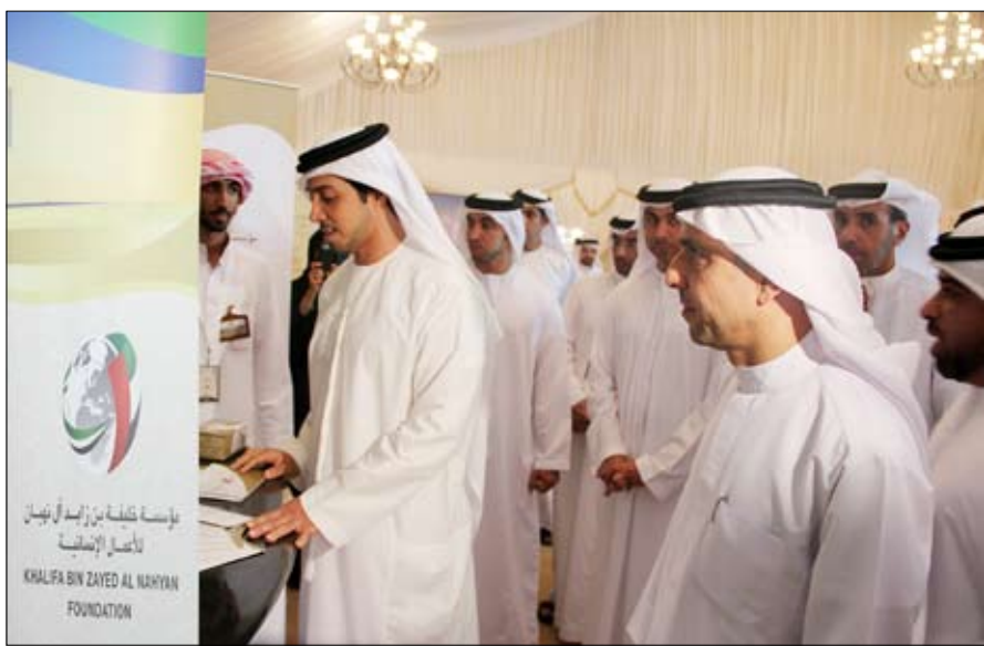
في المهرجان كما شهد الجناح توافد الزوار عليه بكثافة وتحرس مؤسسة خليفة الإنسانية على التواجد كل عام في هذا المعرض أو مساعدة الاسر المواطنة.

مثل القرية العالمية في دبي واكسبو الشارقة. وأوضح أن مؤسسة خليفة للأعمال الإنسانية وقعت مذكرة تفاهم مع مهرجان ليوا للرطب تم بموجبها حصول المؤسسة على 50 محلا بالمعرض تعرض فيه مائة أسرة مواطنة منتجاتها من المشغولات اليدوية والعلطور والدخون والموروثات التراثية الأخرى بهدف إيجاد مصادر دخل لهذه الأسر ودعم مواردها الذاتية. وتعتبر مشاركة المؤسسة في هذا المعرض الأولي من نوعها بجناح